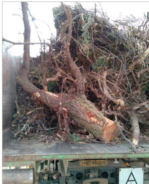
Illegal abgelegte Baumstämme und Wurzelwerk am Bauhof Apolda Anfang April

Die illegale Benutzung der Grünschnittsammelplätze durch kreisfremde Bürger und Gewerbetreibende verursachen Mehrkosten. Insbesondere die Entsorgung von Baumstämmen anstatt haushaltsüblicher Mengen an Ast-, Strauch- und Baumschnitt, wie erst kürzlich Anfang April auf dem Bauhof in Apolda.